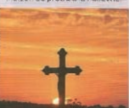
Croix du cimetière (1926).