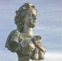
La République (1906).

La suite du sentier, magnifique à l'automne, longe les bois qui escaladent le plateau et offre des vues sur le marais et le bourg de Rimou. Il y a peu, le sentier passait à Montmoron. Ce n'est plus le cas, mais du coup on n'est pas allé jusqu'au bout du réaménagement du sentier. Celui-ci pourrait encore être amélioré de ce côté.