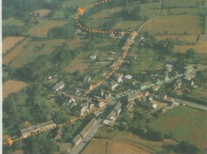
Cette vue aérienne montre le bourg de Romazy, centré sur la mairie (qui fut le presbytère). Les points orangés indiquent le tracé du sentier roman. En vert, le détour par La Godinette.

La commune de Romazy ne dépasse guère 700 hectares et compte moins de 300 habitants. Mais par chance elle est bordée par le Couesnon et s'y croisent la route du Mont-Saint-Michel et le sentier roman venant de Rennes. Son patrimoine religieux compte : église d'origine romane, chapelle de Montmoron, mais aussi maisons de prêtres et croix, que nous évoquons ici.