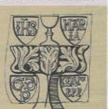
Logis du prêtre G. D. (1530).