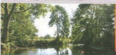
Le Couesnon au bas du Roquet.