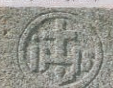
Maison de prêtre à la Poilevrie.