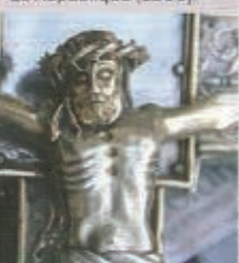
Croix de procession (XV e s.).