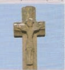
La croix d'enclos (XV e s.).