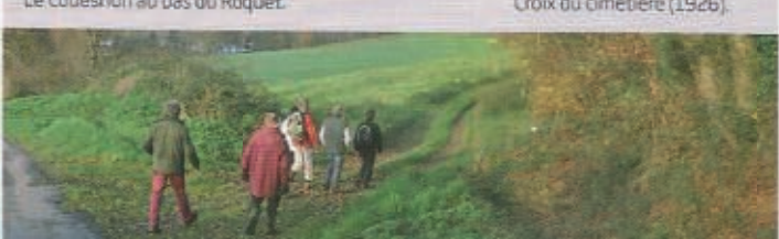
Quittant le bourg, un groupe s'engage sur le GR 39 vers Tremblay.