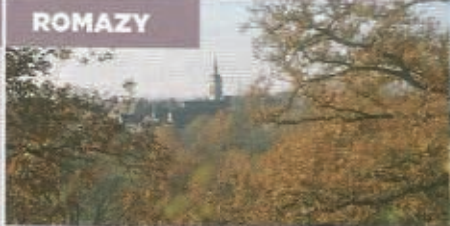
Rimou vu du sentier roman.