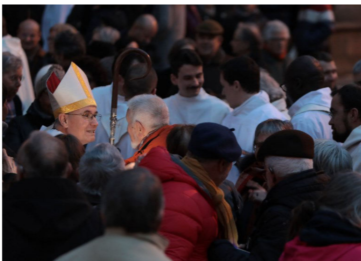
Article proposé par rennes.catholique.fr

Malgré les « années d'épreuve » et les « scandales », « Nous sommes cette Église au cœur du monde, ici et là. Nous n'existons pas pour nous-mêmes, mais pour être envoyés. » « Je crois en l'Église en laquelle l'Esprit Saint trouve sa joie et sa fécondité. Devenons des missionnaires humbles, jeunes et renouvelés, à la manière de Paul, Priscille et Aquila ! Devenons des témoins de Jésus-Christ dans la fraternité, au sein de communautés locales joyeuses, servantes de toute vie humaine, de la plus fragile à la plus prometteuse. Que les jeunes s'emparent de cette ambition. Rendons témoignage des moments et des lieux de nos vies où Dieu nous a sauvés de la mondanité, de la tristesse, des vices de ce monde et des idolâtries, des impasses et des doutes, des addictions et des peurs. Nous portons le Christ dans des vases d'argiles , nos humanités, mais si nous devenons de réels christophores, une lumière finira bien par gagner au-delà de nous, avec nous, le champ de la moisson. Que notre Église est belle, formée de tous ses membres ! Cette Église existe pour le monde. »