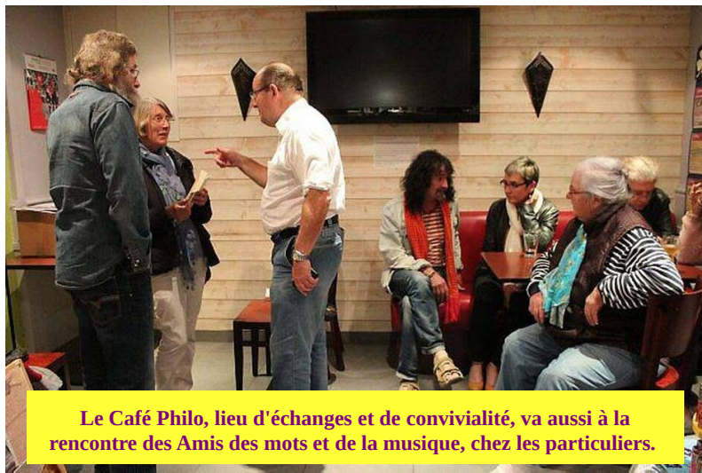
Le Café Philo, lieu d'échanges et de convivialité, va aussi à la rencontre des Amis des mots et de la musique, chez les particuliers.