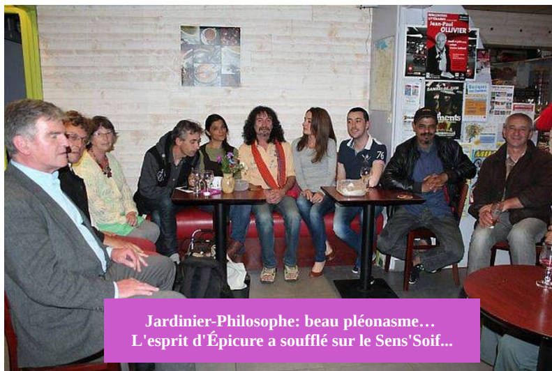
Jardinier-Philosophe: beau pléonasm... L'esprit d'Épiculture a soufflé sur le Sens'Soif...