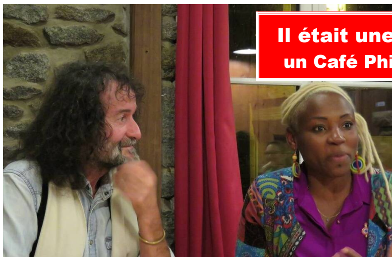
Il était une fois un Café Philo...