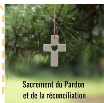
Sacrement du Pardon et de la réconciliation

Célébration du Pardon Samedi 9 mars 10h30 Bazouges Pour les adultes et les enfants